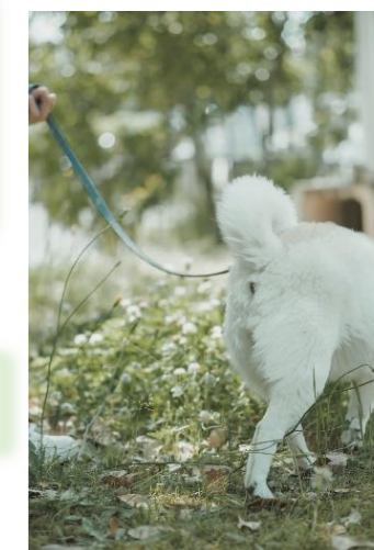
耳、瞳、おしりなどにフォーカスして撮るのも面白い！

猫は動いている物を集中して見ていることが多いので、猫が興味を示す物を使うと視線をこちら側に向けた写真が撮りやすいと思いますが、私個人としては、猫が毛づくろいしているところなど猫らしい仕草をしているところを撮るのが好きです。