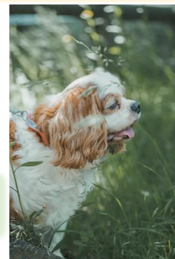
同じ目線の高さで撮ることも大切！

私がペットを撮影する時にいつも心掛けていることは、無理に静止させて撮るよりも、その子の自然な姿や表情を撮ることです。同じ目線の高さで撮ることも大切にしています。