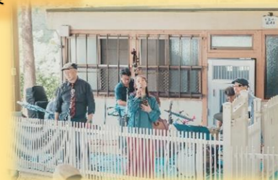
2023 ジャズコンサートの様子